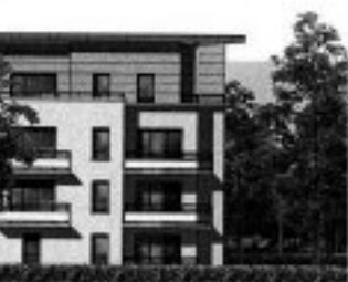
ence Amadeus, boulevard le 16 novembre dernier.