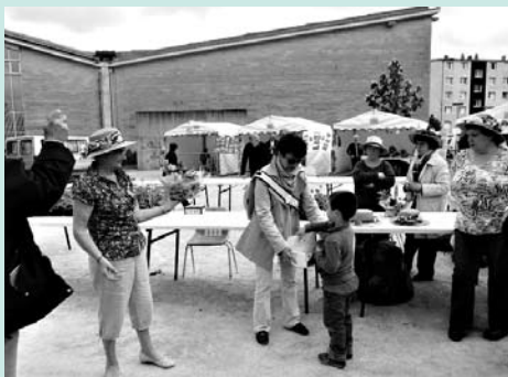
Résultats du concours « tri des déchets ».

Quand ? Pour éviter que les déchets s'entassent, il vaut mieux vider régulièrement les sacs ou caisses dans les bacs et conteneurs prévus à cet effet.