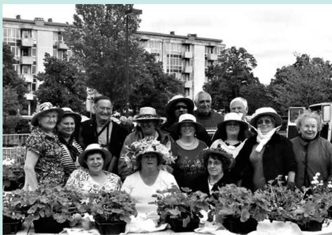
Les membres de l'Association Guérinière en Fleurs.

La Fête des Fleurs a fait sa première apparition dans le quartier de la Guérinière en 2002. Sept ans après, elle rencontre toujours le même succès et la même ferveur ! Avec une nouveauté cette année, un concours pour sensibiliser au tri des déchets.