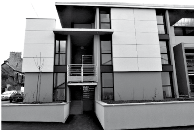
Architecte : Agence Charpentier

Enfin, 9 logements disposent d'un garage et 3 places de sta-