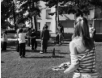
Goûter et jeux pour les enfants et buffet de roi à la Grâce de Dieu