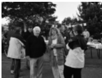
Les samoussas de la rue Alfred de Musset