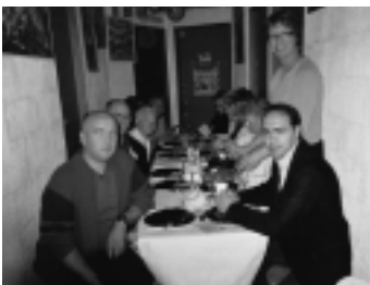
Le repas convivial de la rue Paul Langevin