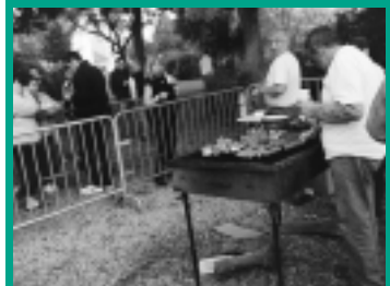
Soirée barbecue géant à la Folie