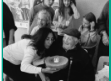
Des originalités pour le bonheur de tous