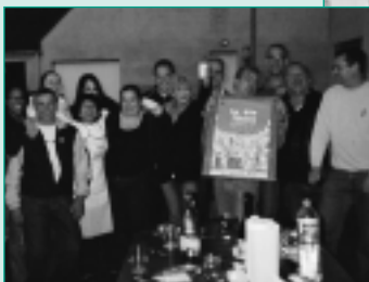
Rue de la Blanche Herbe