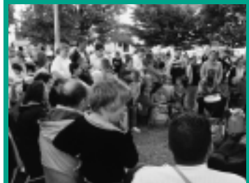
Soirée musicale avec Calao à la Guérinière